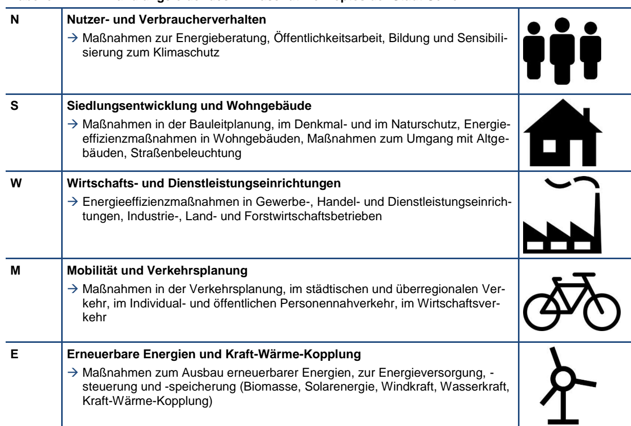
Tabelle 1-1: Handlungsfelder des Klimaschutzkonzeptes der Stadt Uelzen

Das Klimaschutzkonzept umfasst folgende Handlungsfelder und Themen: