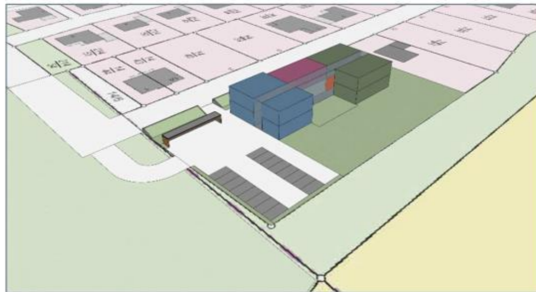
1 x Krippe u. 3 x KiGa